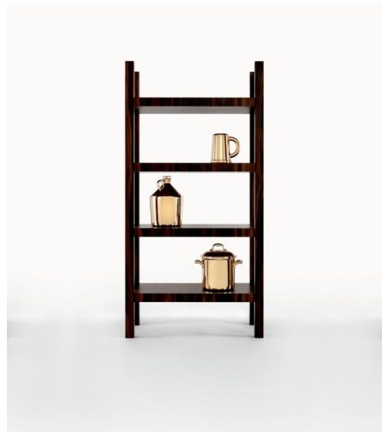
Farm (2008) par Studio Job

Lidewij Edelkoort présentera les tendances intérieur & design 2015 le 13 septembre à 14h00 à l'Institut Néerlandais. Pour réserver des billets et plus d'informations sur Trend Union veuillez contacter Corinne Lasalle, corinne@trendunion.com