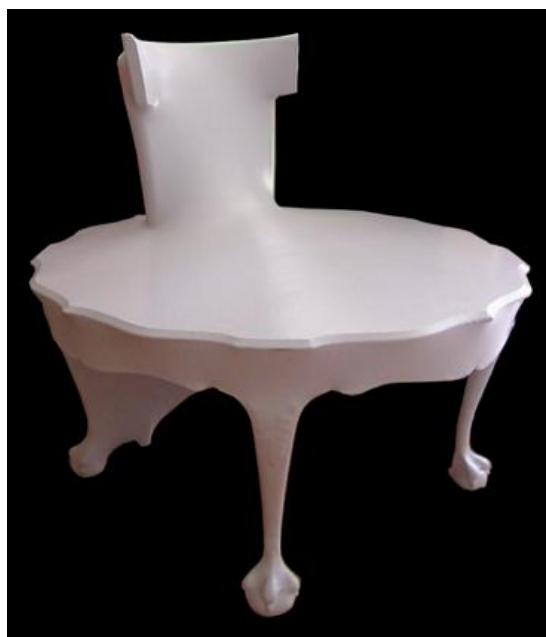
Kokon Round Table Chair (1999) par Jurgen Bey

L'exposition déploie dans les salons du 4ème étage de l'Institut Néerlandais des œuvres de designers contemporains rarement vues en France, telles que Pump It Up , le projet lauréat de Nacho Carbonell (Espagne), une édition de pigment naturel du mobilier Clay de Maarten Baas (Pays-Bas), également du même artiste un grand piano bébé carbonisé, le premier d'une série pour sa fameuse collection Smoke , les Glassworks de Dick van Hoff (Pays-Bas), un fauteuil TransPlastic par Fernando & Humberto Campana (Brésil), des œuvres Farm par Studio Job (Pays-bas) et 7 Pots / 3 Centuries / 2 Materials , des pièces uniques de Hella Jongerius (Pays-Bas).