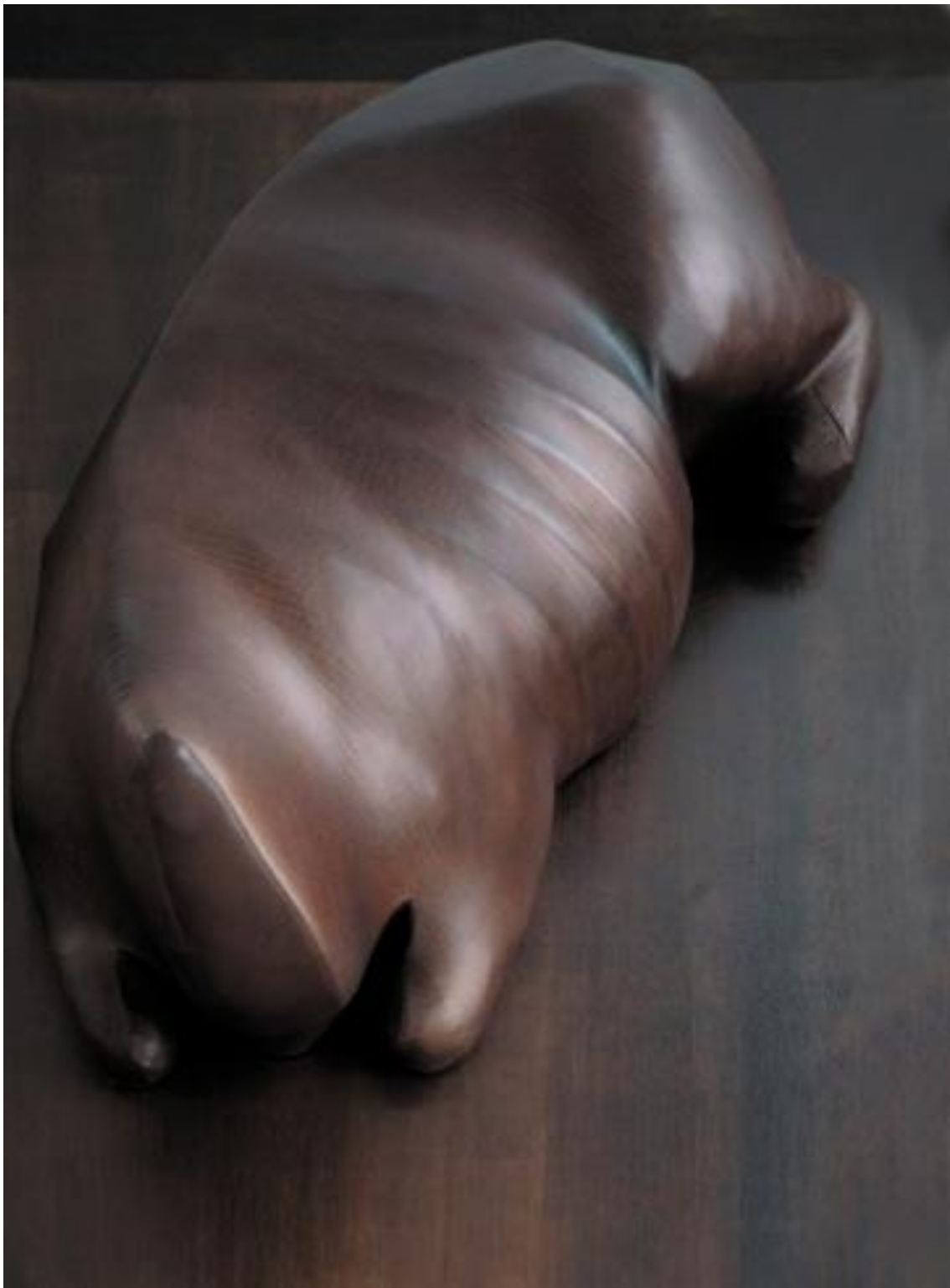
Belinda (2005) par Julia Lohmann