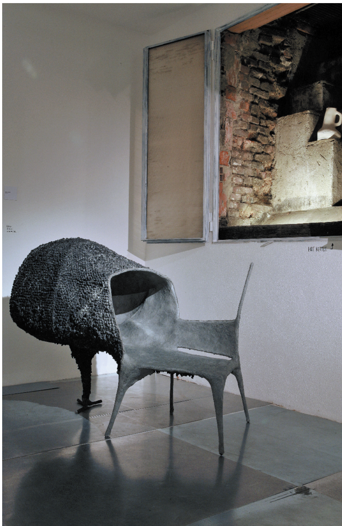
Evolution (2008) par Nacho Carbonell