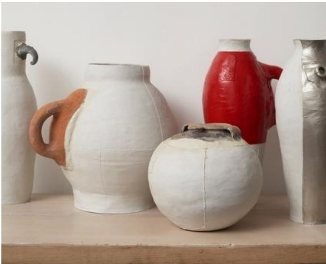
7 Pots / 3 Centuries / 2 Materials (1997) par Hella Jongerius