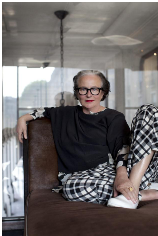
Lidewij Edelkoort

Edelkoort a collectionné des pièces de design qui ont suscité des tendances majeures. Tendances créées par une nouvelle génération étant en phase avec la technologie dans un contexte post-millénaire et explorant également souvent l'artisanat et les valeurs de la matière.