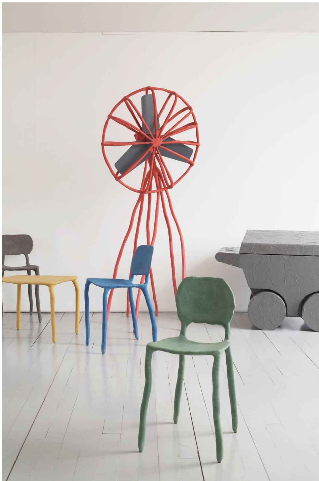
Clay (2010) par Maarten Baas, Tool Barrow (2001) par Studio Job