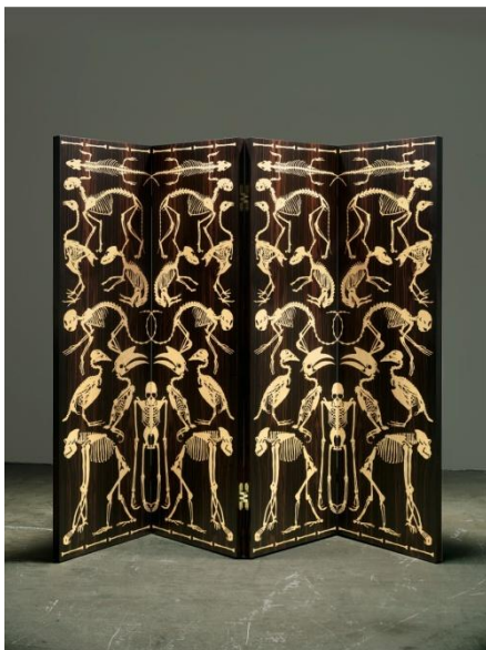
Perished Screen (2006) par Studio Job