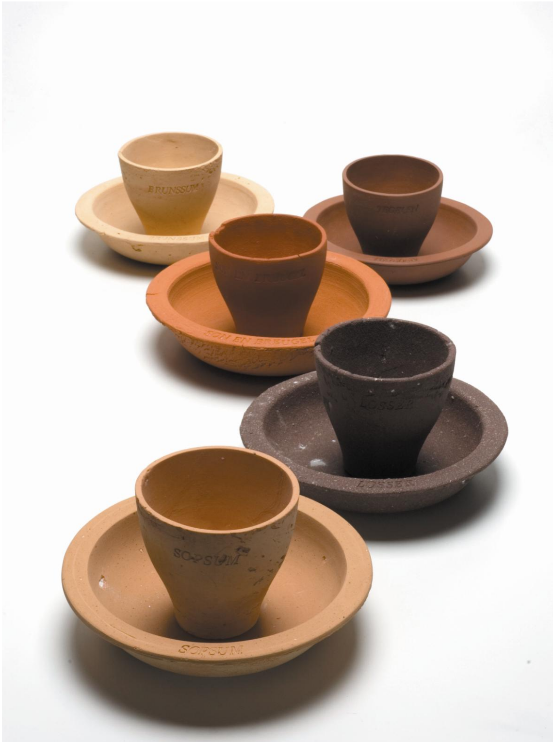
Drawn from Clay (2006) par Lonny van Ryswyck