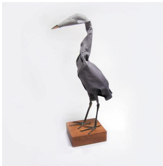
Avifauna (2010) par Maarten Kolk & Guus Kusters

couleur ainsi que des textes sur le design contemporain signés par Lidewij Edelkoort. Une séance de dédicace avec l'auteur se tiendra pendant le vernissage le 10 septembre à 20h.